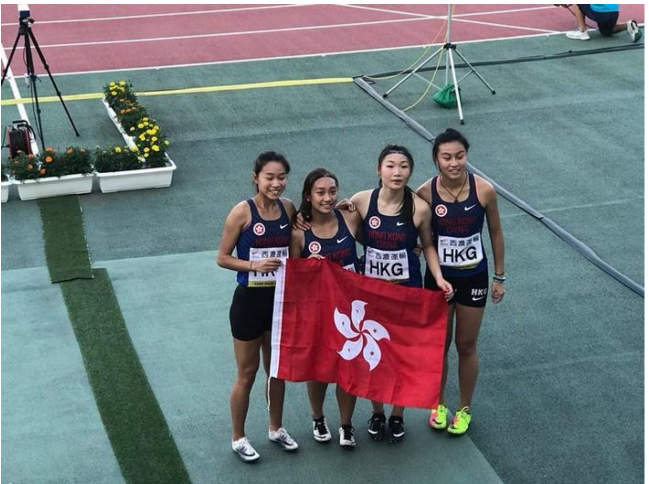
香港業餘田徑總會圖片