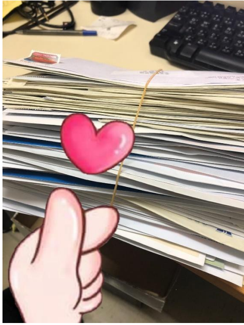
(圖片二：給每一位同學的「情」信)