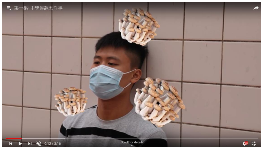
圖片四：第一集《中學停課五件事》

生命教育往往要與時並進！我們生命教育支援組的成員在停課期間建立了「青年抗疫日常」影片頻道及「生命教育組與你共渡疫境」Google Classroom 平台。透過網上的平台，逢星期五推出由生命教育組自編自導自演的短片，觸碰同學的心靈。同時，亦鼓勵同學創作短片參與「青年抗疫日常」短片創作比賽，讓同學可以在停課期間有一個另類的課外活動。最令我們鼓舞的是我們所做的也得到家長的認同及讚賞。