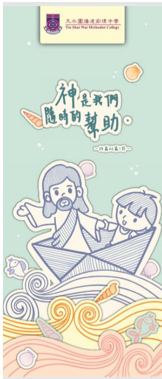
(圖片一：本校自家製「神是我們隨時的幫助」心意卡)

在疫情下，我們面對很多無常和失去，最多的失去就是人與人的面對面接觸。同學不能回校上課、不能與同儕友好在課餘下傾談嬉戲、不能參與興趣班。在減少日常社交、長困在家中及只對著螢幕的日子下，同學很容易迷失方向。於是，我們用傳統的方法聯繫同學。我校的班主任在二月中旬，用「Warm Call」聯絡每一位學生的家長，了解學生的身心靈需要和學生的作息情況，班主任亦親自向家長和學生預告三月開始的即時網上教學安排。同時，生命教育支援組的成員為每一位學生寄上本校自家設計的心意卡(圖一)，並親筆寫上鼓勵和慰問的說話。這些方法雖是傳統，但卻永不過時。